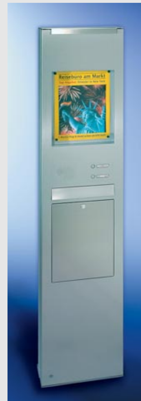
Linie commercial Edelstahl-Säule V4A, einteilige Briefkastenanlage, Schrägeinwurf 335 x 50 mm, XXL-Kastenmaß 335 x 770 x 140 mm, Entnahmekipptüre 335 x 440 mm mit 2 Öffnungsbegrenzern. Mit RS4 , LED-Beleuchtung, integrierter Mitteilungskasten mit Beleuchtung Sichtfläche 335 x 420 mm (für DIN A3), Säulenhöhe 2000 mm, Säulentüre DIN links angeschlagen.