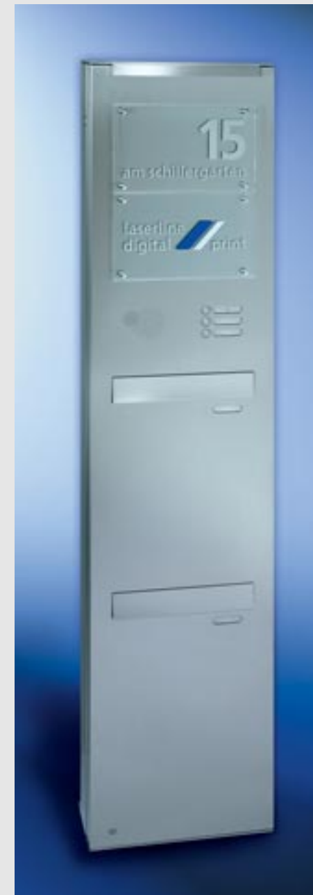
Linie commercial Edelstahl-Säule V4A, zweiteilige Durchwurfbriefkastenanlage, mit RS4 , Schrägeinwurf 335 x 50 mm, Kastenmaß 335 x 550 x 140 mm, Entnahmekipptüren 335 x 440 mm mit je 2 Öffnungsbegrenzern, LED-Beleuchtung, Acrylglasplatten 335 x 215 mm mit Folienbeschriftung, Säulenhöhe 2000 mm, Säulentüre DIN rechts angeschlagen.

Was bleibt, ist viel Raum für Ihre Ideen.