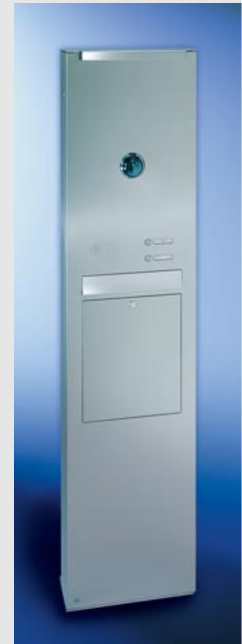
Linie commercial Edelstahl-Säule V4A, einteilige Briefkastenanlage, Schrägeinwurf 335 x 50 mm, XXL-Kastenmaß 335 x 770 x 140 mm, Entnahmekipptüre 335 x 440 mm mit 2 Öffnungsbegrenzern. Mit RS4 , LED-Beleuchtung, eingebaute Videokamera (bauseits gestellt), Säulenhöhe 2000 mm, Säulentüre DIN rechts angeschlagen.