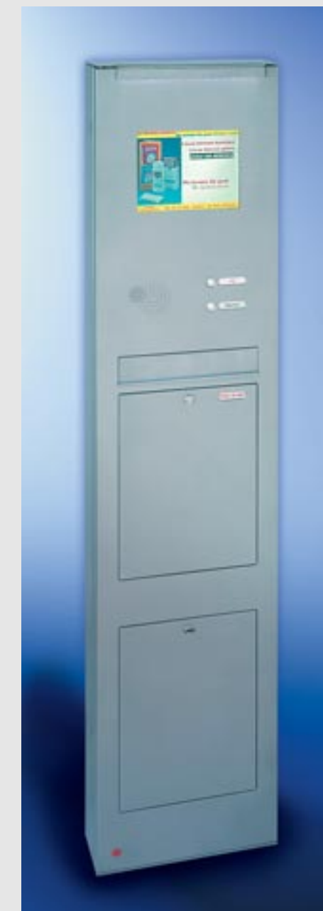
Linie commercial Stahl-Säule pulverbeschichtet, einteilige Briefkastenanlage, mit RS4 , Schrägeinwurf 335 x 50 mm, Kastenmaß 335 x 550 x 140 mm, Entnahmekipptüre 335 x 440 mm mit 2 Öffnungsbegrenzern, Depotfach mit Drehverschluss, LED-Beleuchtung, integriertes Farb-TFT-LCD-Display, Säulenhöhe 2000 mm, Säulentüre DIN rechts angeschlagen.